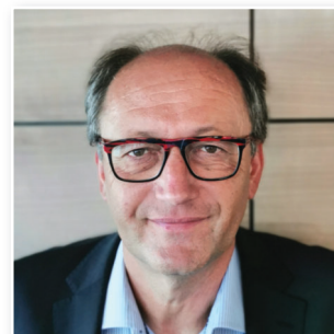
Presidente Peter Schweinschwaller AUSTRIA

Il Comitato Esecutivo, composto da quattro membri eletti presidenti nazionali o regionali delle associazioni di tabaccherie nei rispettivi Paesi, realizza le azioni necessarie al raggiungimento degli obiettivi della Confederazione. Coordina le attività e le commissioni di lavoro e decide in merito alle principali strategie di comunicazione della CEDT.