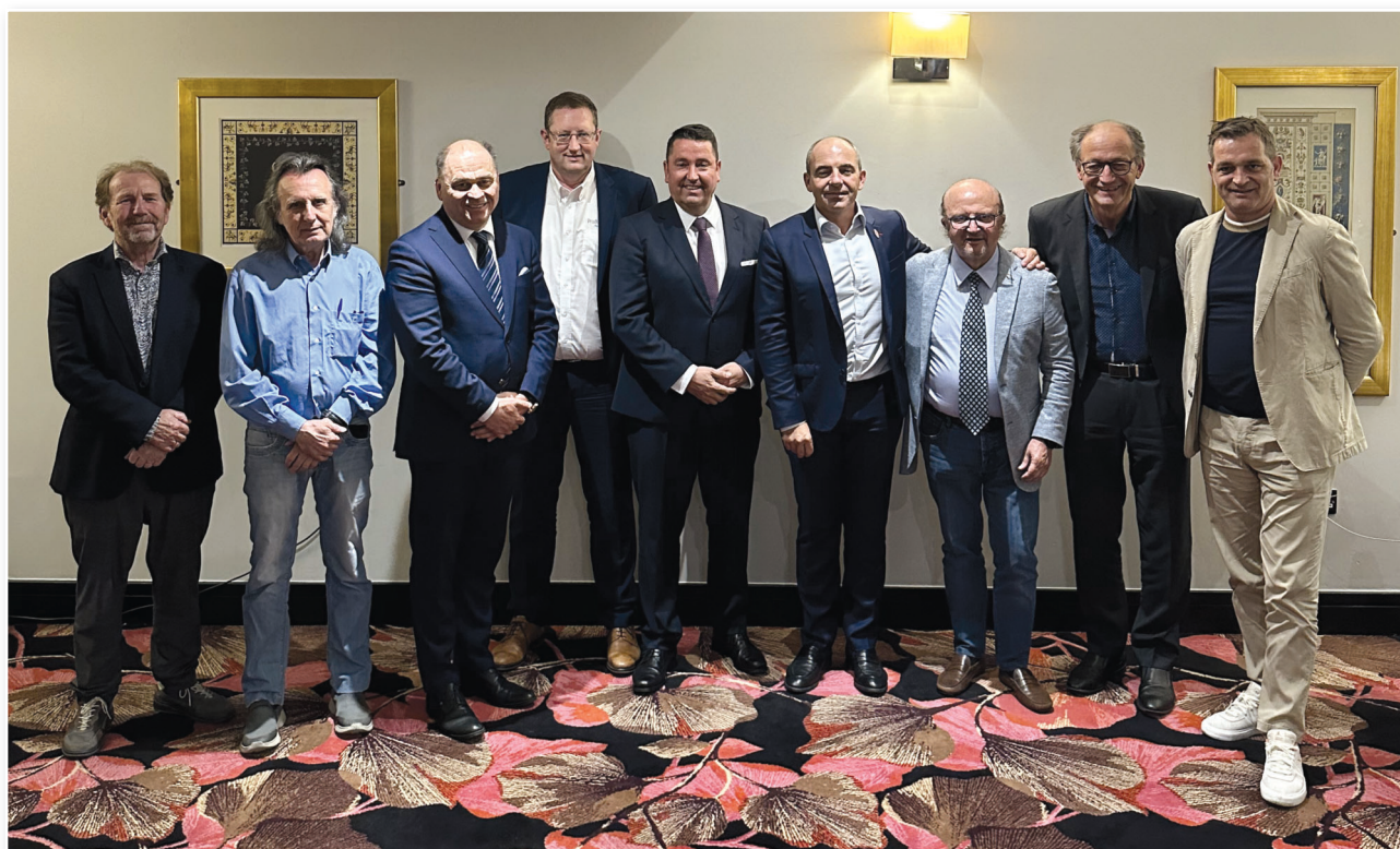
CEDT - Dublino