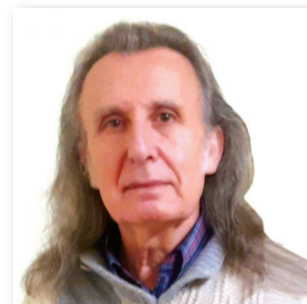
Presidente Theodoros Mallios GRECIA